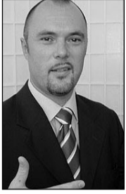
● VON MARCELLO SCARNATO*

Wie ein Alpenländer in «Deutschstadt» Business macht